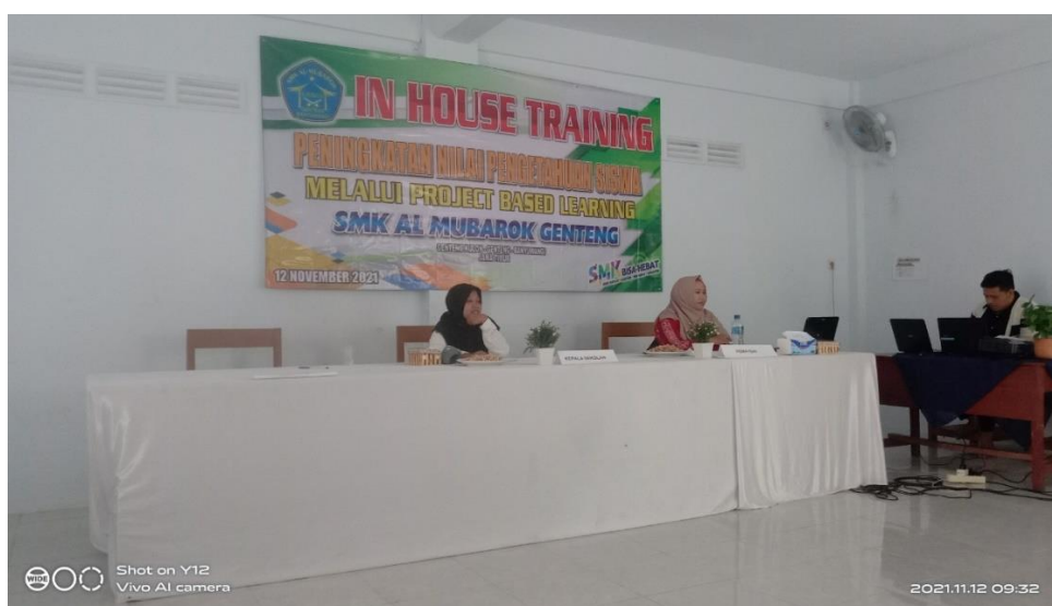
Gambar 4. Presentasi Hasil Pengembangan RPP

Peserta kemudian diberikan waktu untuk mengembangkan RPP project based learning secara lengkap sesuai dengan sintaks PBL yang telah disampaikan. Peserta mengembangkan RPP sesuai dengan template yang diberikan oleh narasumber guna persamaan persepsi dalam rancangan RPP yang dibuat. Setelah selesai mengembangkan RPP, beberapa peserta dipilih secara acak untuk mempresentasikan hasil RPP project based learning yang telah dikembangkan guna dianalisis bersama kesesuaiannya dengan sintaks/langkah-langkah PBL.