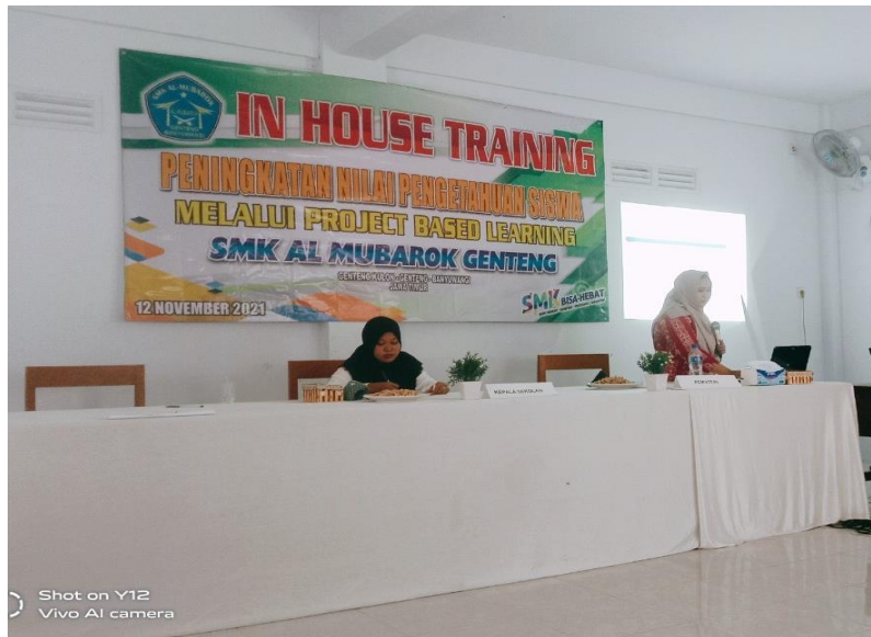
Gambar 2. Penyampaian Materi oleh Narasumber

Pada penyampaian materi terkait tujuan pembelajaran, peserta diminta untuk menganalisis kata kerja operasional sesuai tingkat kognitif Taxonomy Bloom versi revisi Anderson. Kata kerja operasional akan digunakan dalam merancang tujuan pembelajaran. Beberapa peserta in house training kemudian mencoba untuk menuliskan tujuan pembelajaran yang dikembangkan di papan tulis guna dianalisis bersama apakah sesuai dengan rumus ABCD ( Audience, Behavior, Condition dan Degree ).