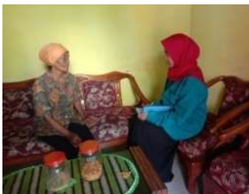
Gambar 1. Kegiatan observasi dan analisis masalah

Sebelumnya tim pelaksana kegiatan pengabdian ini melakukan observasi awal dan analisis permasalahan. Pada tahap ini, dilakukan wawancara kepada peserta pendampingan (mitra) serta mengamati produk keset kaki kain perca yang dihasilkan. Kegiatan ini dilakukan pada tanggal 18 Juni 2020 bertempat di desa Jajag kecamatan Gambiran. Tahap persiapan ini berjalan dengan baik dan diketahui bahwa permasalahan yang dialami oleh mitra adalah : 1) produk yang dihasilkan masih sederhana sehingga sulit bersaing dengan produk lain, 2) pemasaran produknya masih sederhana, masih bergantung pada penjualan di pasar.