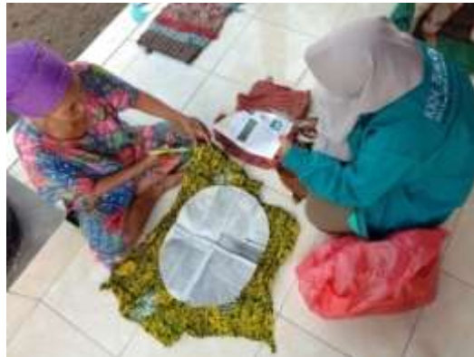
Gambar 2. Pelatihan Inovasi Produk Baru Bersama Mitra.