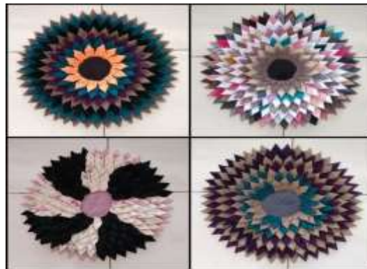
Gambar 5. Inovasi Produk Baru Kaset Kaki Kain Perca.

Serta tersedianya laman media sosial UMKM kaset kaki kain perca, dan pahami mitra mengenai apa yang harus dilakukannya dengan laman tersebut untuk memaksimalkan penjualan.