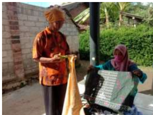
Gambar 3. Pelatihan inovasi produk dengan desain baru

Pada tanggal 02 Juli 2020 dilaksanakan pelatihan pemasaran secara online . Tim pengabdian terlebih dahulu menyampaikan strategi pemasaran bagi UMKM, dan bagaimana memaksimalkan sosial media yang dimiliki untuk memasarkan produk UMKM.