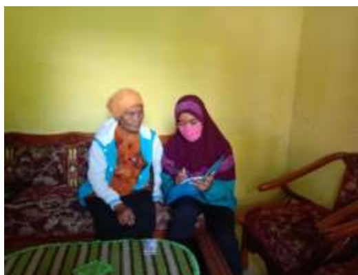
Gambar 4. Pembuatan Laman Sosial Bersama Mitra Serta Cucu Mitra

Pada tanggal 04 Juli 2020 dilaksanakan evaluasi kegiatan dalam pelaksanaan pembuatan inovasi produk baru dan pemasaran secara online . Indikator tercapainya tujuan pelatihan dan pendampingan ini adalah telah di buatnya produk-produk baru keset kaki kain perca dan telah dipasarkan secara online melalui platform shopee.